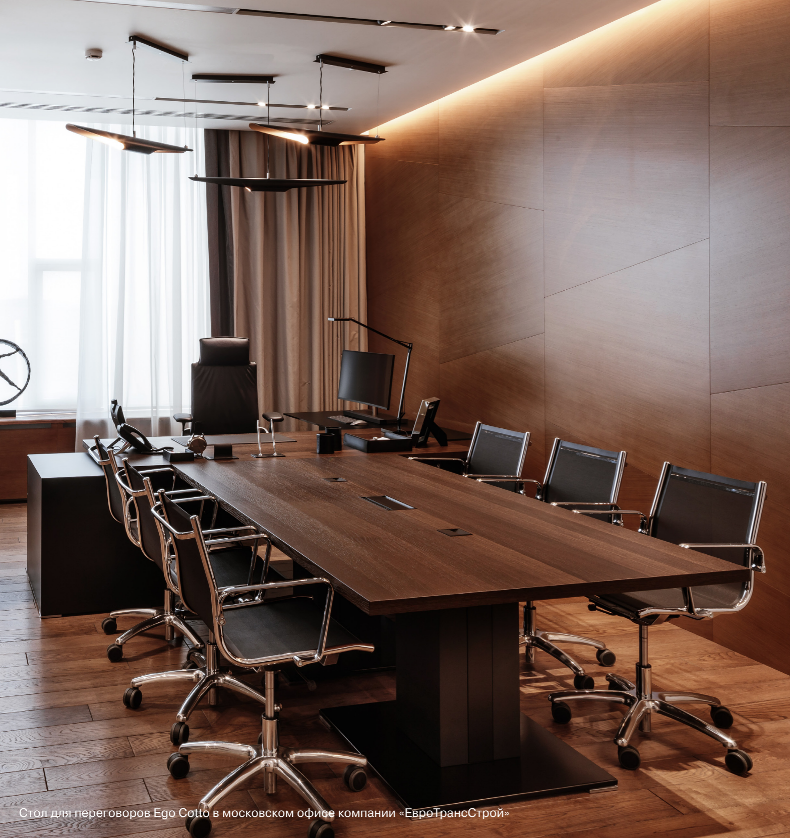
Стол для переговоров Ego Cotto в московском офисе компании «ЕвроТрансСтрой»