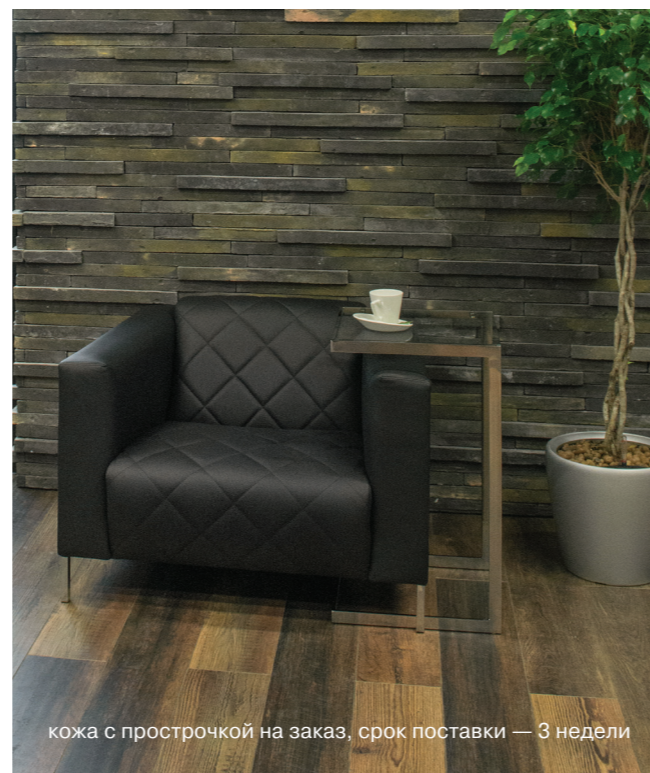
Коллекция Vispo в зале ожидания Аэропорта Шереметьево, г. Москва