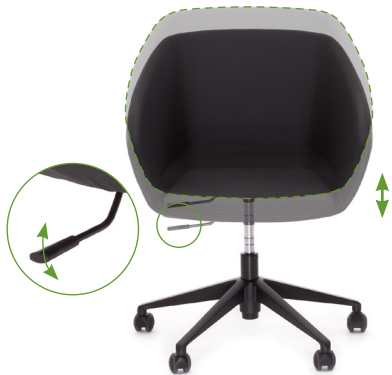
Регулировка высоты сиденья

Для комфортного пользования креслом рекомендуем настроить его перед использованием.