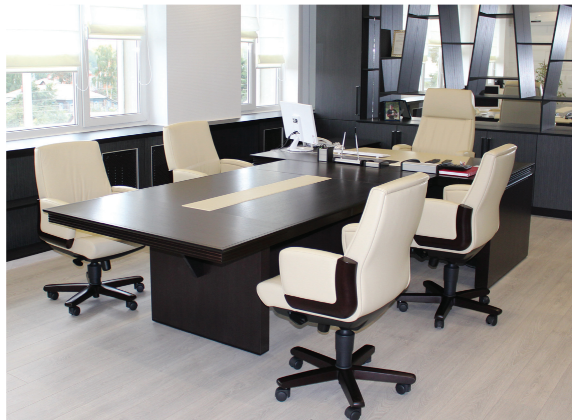
Кресла Dico/A и Dico/B в офисе торговой компании, г. Саранск