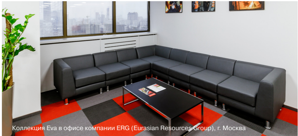
Коллекция Eva в офисе компании ERG (Eurasian Resources Group), г. Москва