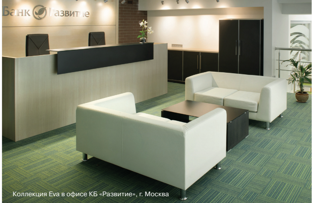
Коллекция Eva в офисе КБ «Развитие», г. Москва