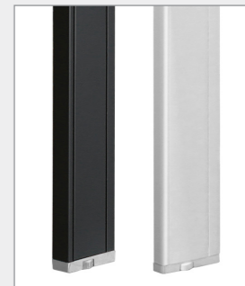
металлические опоры цвета: черный, белый