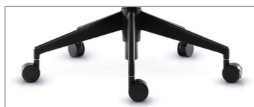
по запросу черный пластик