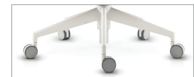
стандартная белый пластик