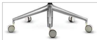
по запросу полированный алюминий