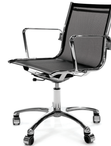
Light-Mesh/B на заказ, срок поставки — 8 недель