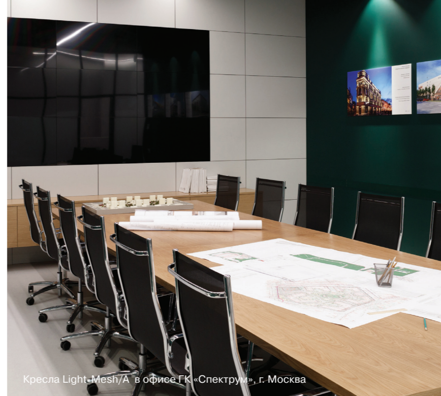
Кресла Light-Mesh/A в офисе ГК «Спектрум», г. Москва

Устройство, изменяющее положение кресла за счет смещения центра тяжести сидящего с фиксацией.