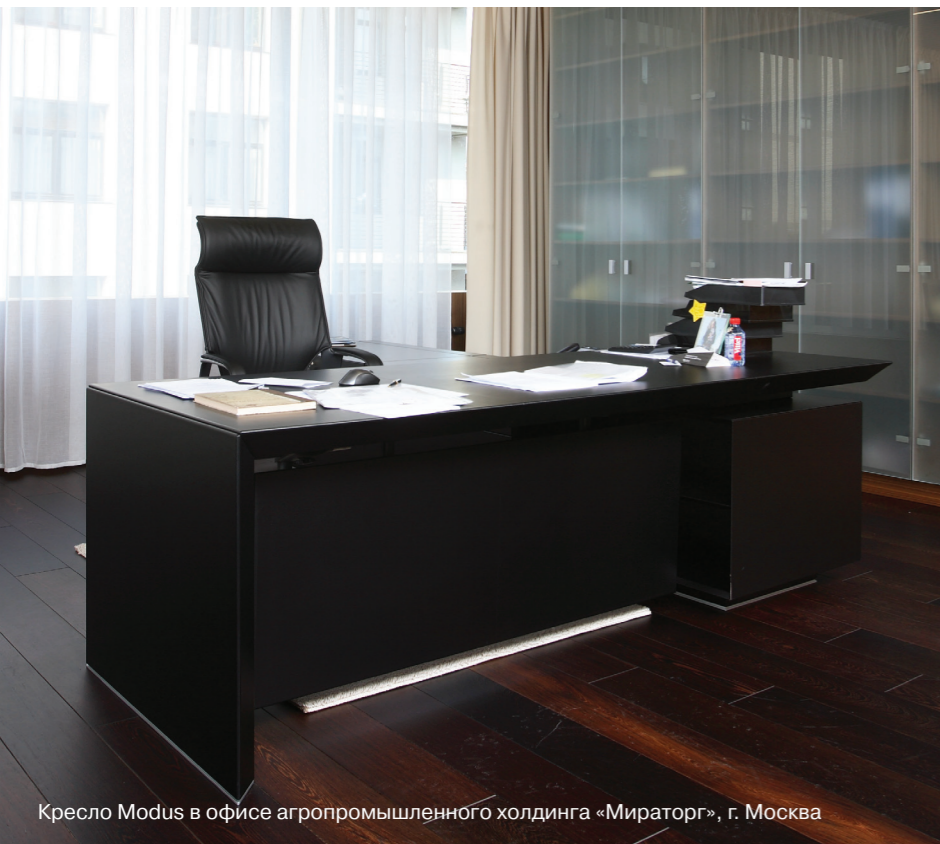
Кресло Modus в офисе агропромышленного холдинга «Мираторг», г. Москва