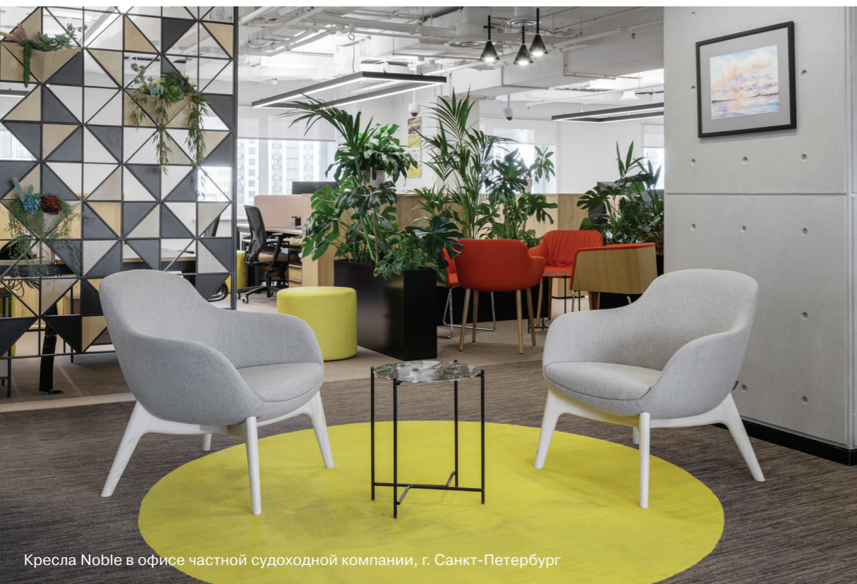
Кресла Noble в офисе частной судоходной компании, г. Санкт-Петербург

в других цветах и материалах на заказ, срок поставки — 3 недели