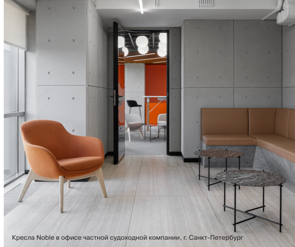
Кресла Noble в офисе частной судоходной компании, г. Санкт-Петербург