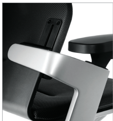
регулировка спинки по высоте с фиксацией в 6 положениях