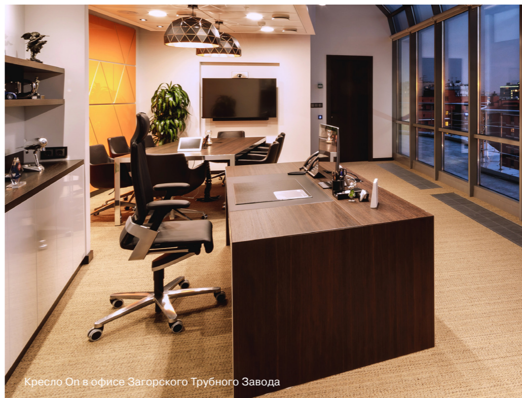
Кресло On в офисе Загорского Трубного Завода