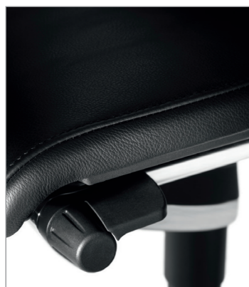
регулировка механизма Trimension®