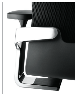
патентованное соединение корпуса кресла с механизмом