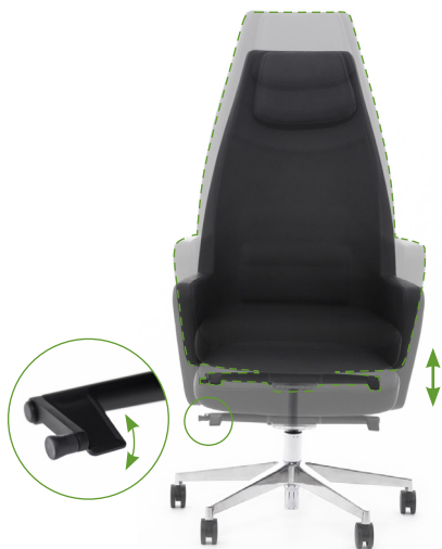
Регулировка высоты сиденья

Для комфортного пользования креслом рекомендуем настроить его перед использованием.