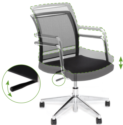
Регулировка высоты сиденья

Для комфортного пользования креслом рекомендуем настроить его перед использованием.